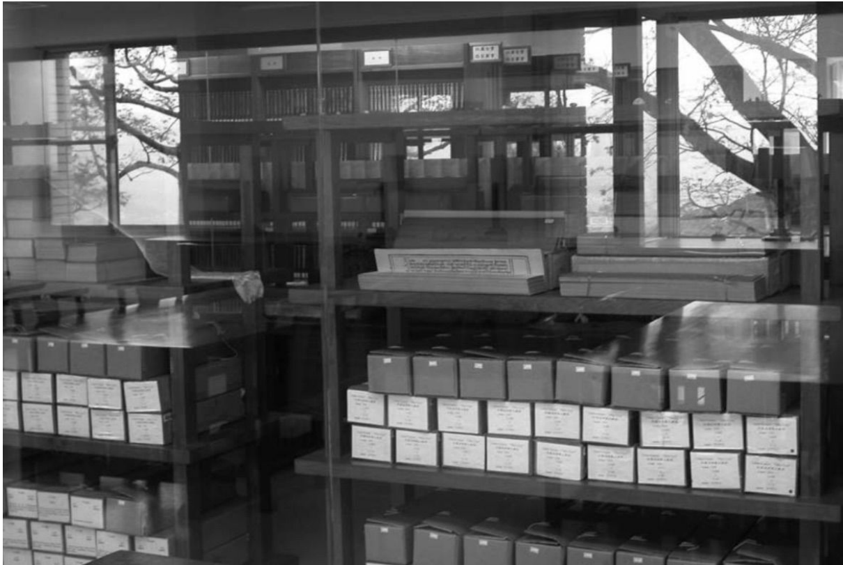
Habitación de sutras climatizada en la biblioteca del Dharma Drum Mountain, Taiwán