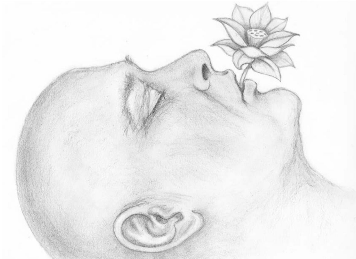
Dibujo por Reene Laffey

en el agua? ¿Cómo puede aparecer en la boca de una persona muerta? Por mucho que la gente pueda dudar, esto es exactamente lo que registraron y afirmaron en la biografía.